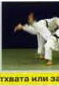
О-сото-гаэши (O-soto-gaeshi). Контрприем от отхвата или за