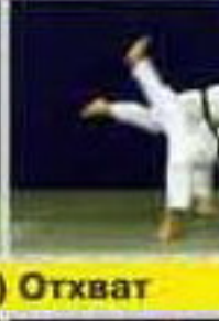
О-сото-гари (O-soto-gari) Отхват