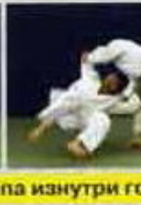
О-учи-гаэши (O-uchi-gaeshi). Контрприем от зацепа изнутри го