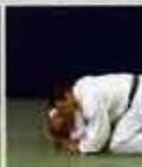
Ката-гатамэ (Kata-gatame). Удержание с фиксацией