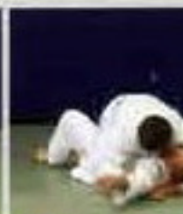
Татэ-шихо-гатамэ (Tate-shiho-gatame). Удержание