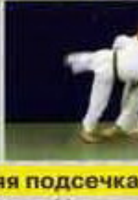
Сасаэ-цурикоми-аши (Sasae-tsuri-komi-ashi) Передняя подсечка