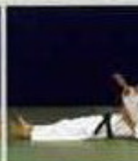
Ками-шихо-гатамэ (Kami-shiho-gatame). Удержание со