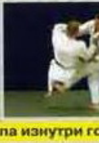
О-учи-гаэши (O-uchi-gaeshi). Контрприем от зацепа изнутри го