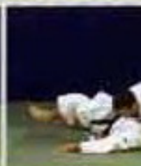
Еко-шихо-гатамэ (Yoko-shiho-gatame). Удержание