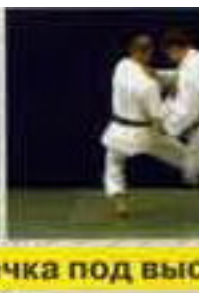
Дэ-аши-барай (De-ashi-barai) Боковая подсечка под высь