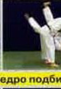
О-гоши (O-goshi) Бросок через бедро подби