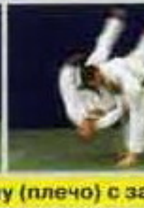
Моротэ-сэой-нагэ (Morote-seoi-nage). Бросок через спину (плечо) с за