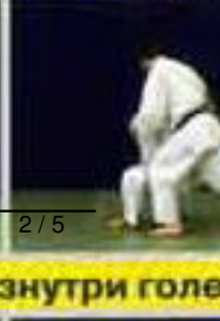
О-учи-гари (O-uchi-gari) Зацеп изнутри голе