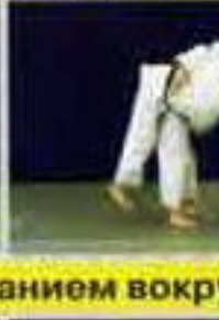
Уки-гоши (Uki-goshi) Бросок скручиванием вокр