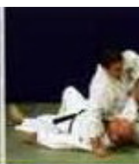
Хон-кэса-гатамэ (Hon-kesa-gatame). Удержание