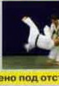
Хидза-гурума (Hiza-guruma) Подсечка в колено под отс